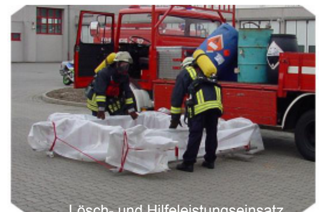
Lösch- und Hilfeleistungseinsatz