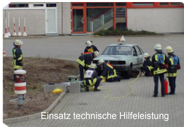
Einsatz technische Hilfeleistung